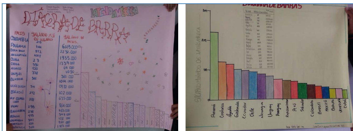
Figura 2. Representaciones gráficas y tabulares elaboradas con los estudiantes de grado 703

Posteriormente surgió la necesidad que los grupos de trabajo representaran los valores de forma gráfica para esto se hizo uso del plano cartesiano por medio de un diagrama de barras, en este proceso los estudiantes debieron hacer uso de la escala en el eje Y, además de organizarlos de mayor a menor de tal forma que se pudiera hacer un mayor análisis a las cifras presentadas en el documento y en la tabla anteriormente construida.